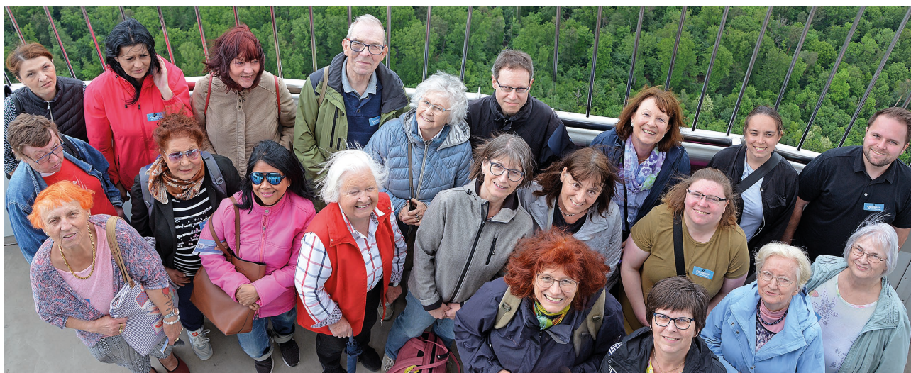
Mitarbeiterinnen der Nachbarschaftshilfe 2024