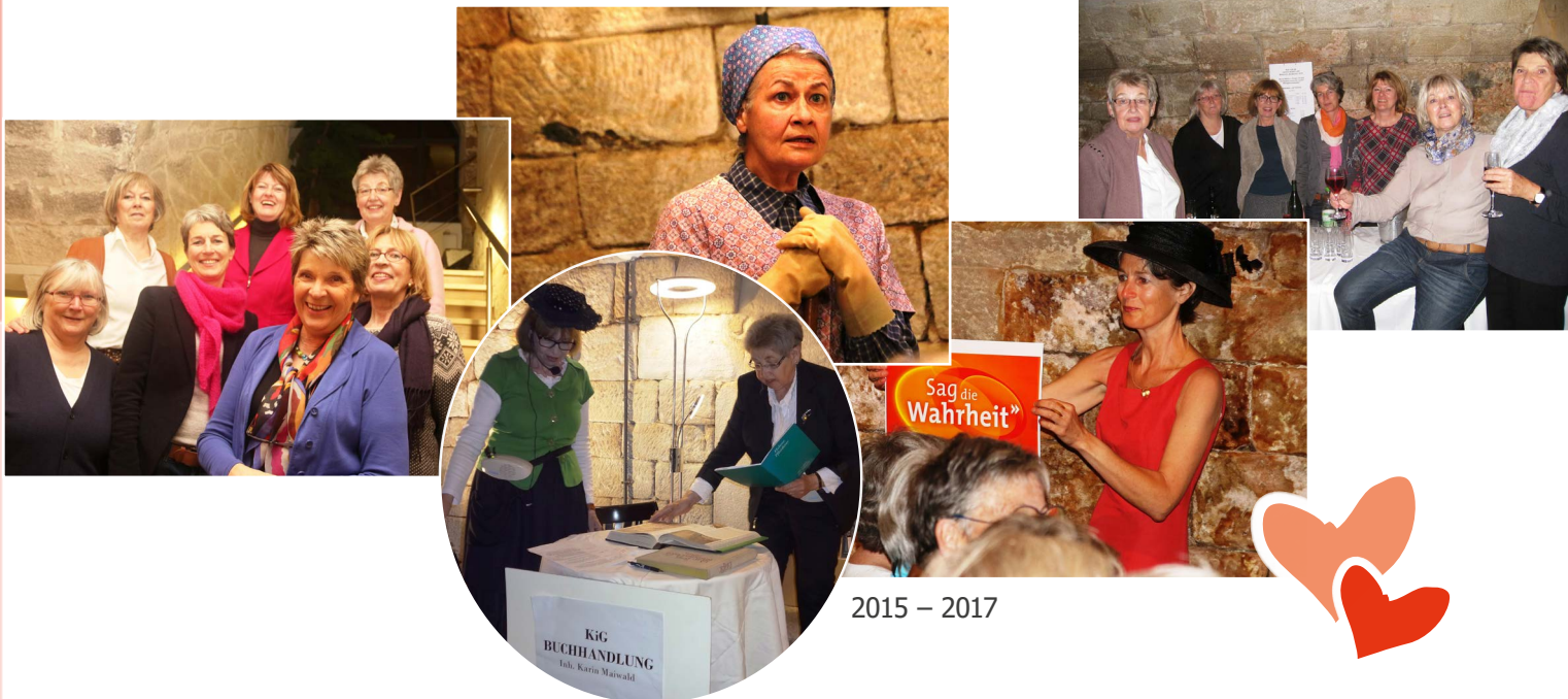
2015 – 2017

„War auf Wein und Kultur eingestellt und hab dann viel über Papua-Neuguinea erfahren – sehr spannend und hoch interessant. Weiter so!“