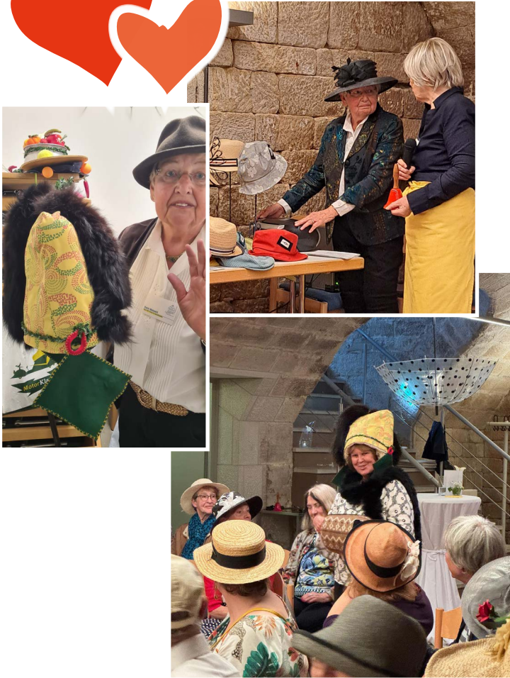
„Hut Couture“ 2024