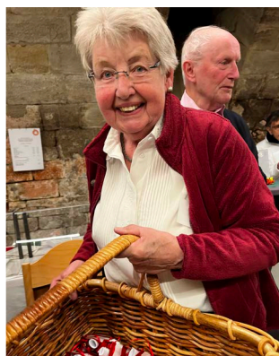
2024 – 2025